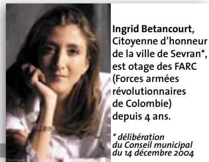
Ingrid Betancourt, Citoyenne d'honneur de la ville de Sevrans*, est otage des FARC (Forces armées révolutionnaires de Colombie) depuis 4 ans.

* délibération du Conseil municipal du 14 décembre 2004